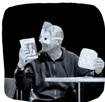
LES GRANDES ESPÉRANCES