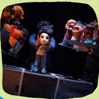
LE ROI DES NUAGES

SOUTIENS : DRAC Bretagne ; Département de la Seine Saint Denis ; Rennes métropole ; Coopérative de production de Ancre Institut International des Arts de la Marionnette